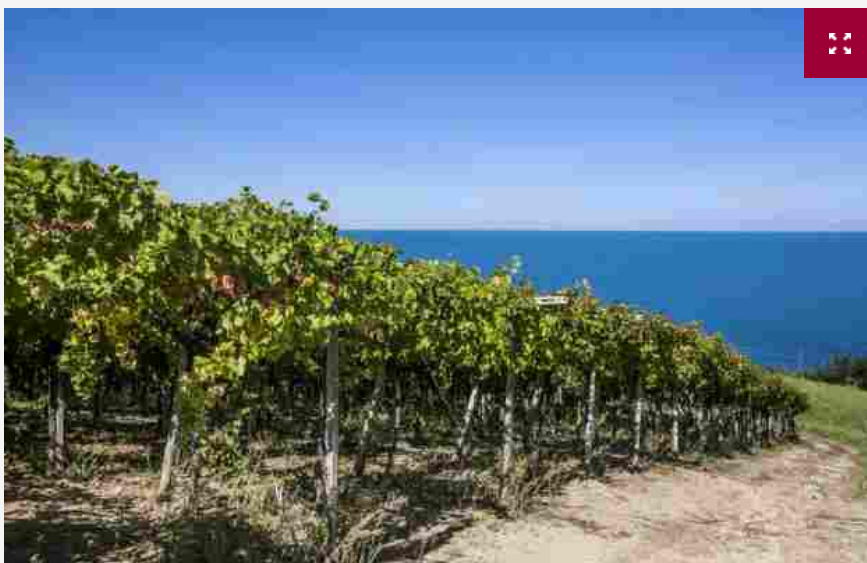
Concorso giornalistico "Words of Wine": i racconti dell'Abruzzo del vino

Dai vitigni celebri, come il Montepulciano e il Trebbiano, agli autoctoni meno conosciuti; dai grandi brand ormai famosi nel mondo alle cantine emergenti; ma anche suggestivi paesaggi di vigneti, dalle pendici della Maiella fino al mare, una cucina proiettata verso il futuro, un'ospitalità calorosa: tutto questo è l'Abruzzo, terra di viticoltura antica, che, negli ultimi venti anni, ha compiuto un incredibile salto in avanti per qualità, immagine e posizionamento. Le storie più belle del vino